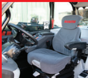
Siège à suspension adaptative