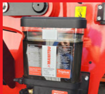
Système de Graissage Automatique (AGS)