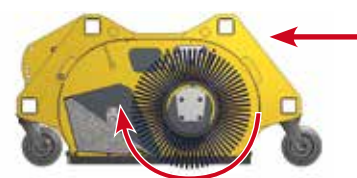
Schéma de coupe de la balayeuse ramasseuse.