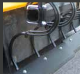
Lame de raclage : 3 sections sur la 2,50 m 2 sections sur la 2,20m